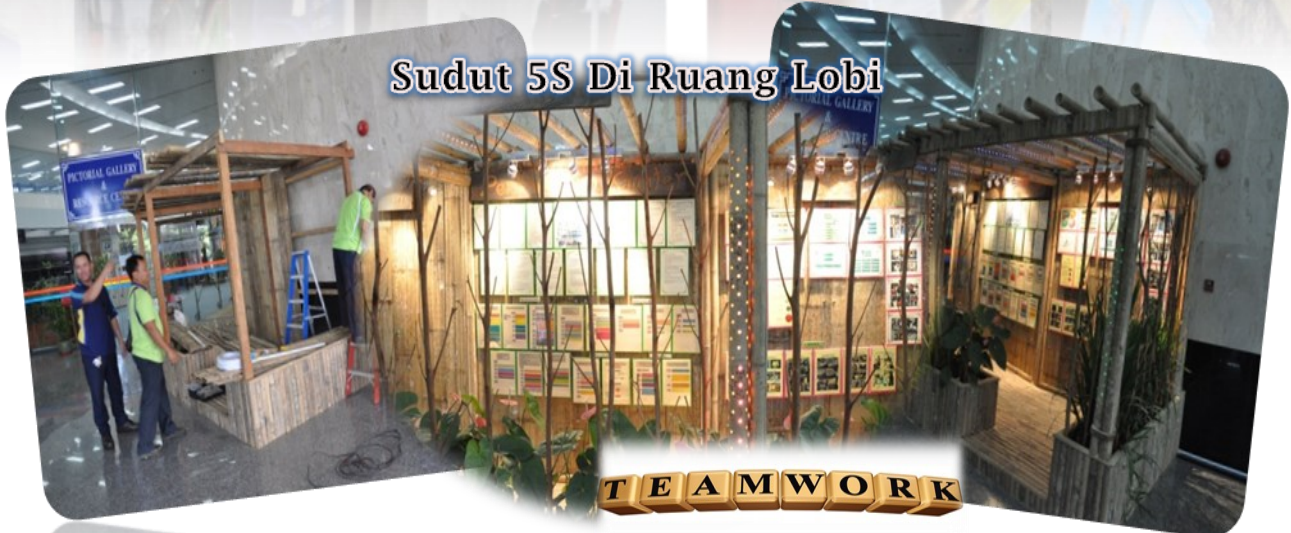
Sudut 5S Di Ruang Lobi