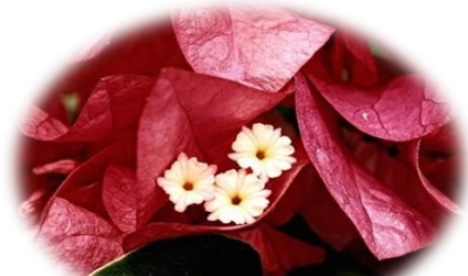
Bougainvillea Chilli Red