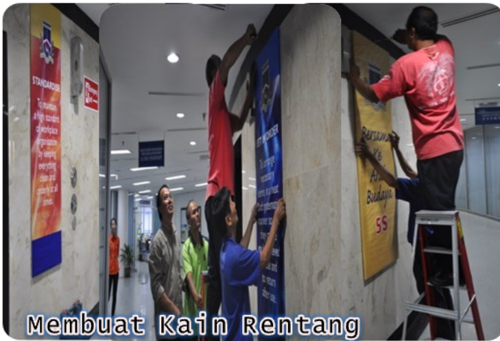
Membuat Kain Rentang