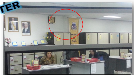
Poster 5S dan jam telah digantung.