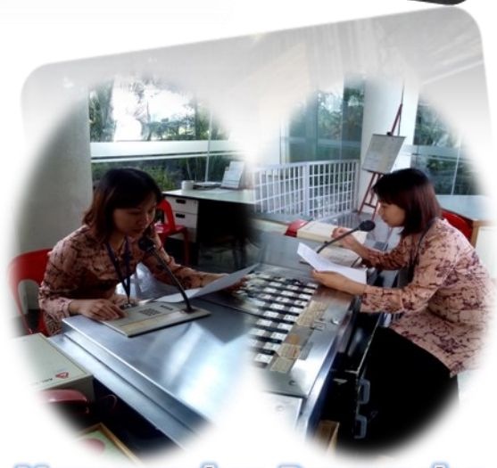
Mewar-warkan Pengamalan 5S Melalui PA System