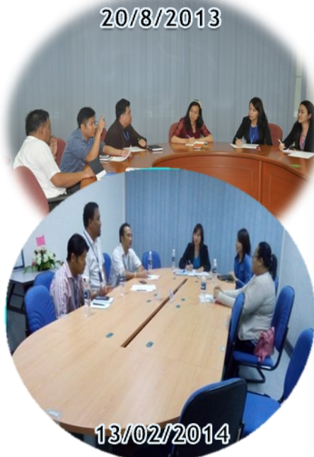
Mesuarat JK Promosi