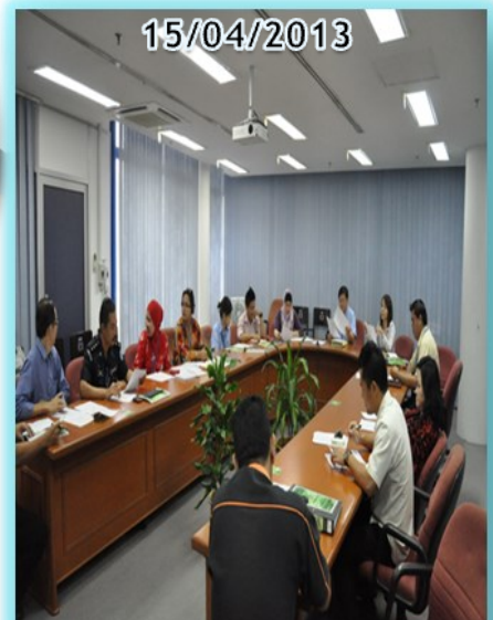
Meyuarat JK Pemandu

Lawatan Sambil Belajar Ke Re- positeri, Pustaka pada 24 Januari 2014 - Lawatan ini bertujuan untuk menambahbaik sistem pengurusan fail bagi mewujudkan sistem elektronik pencarian fail yang impaknya akan memendekkan masa pencarian.