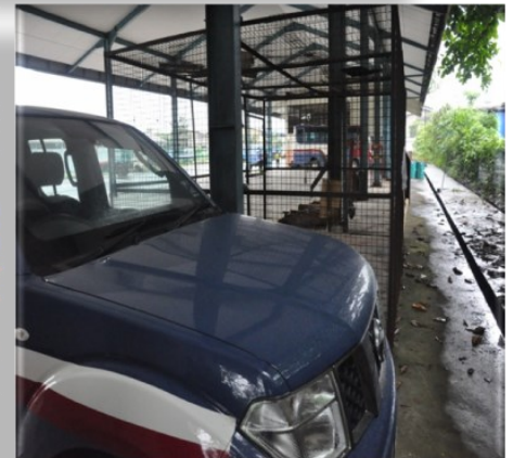
Audit Bengkel - 25 Mac 2014