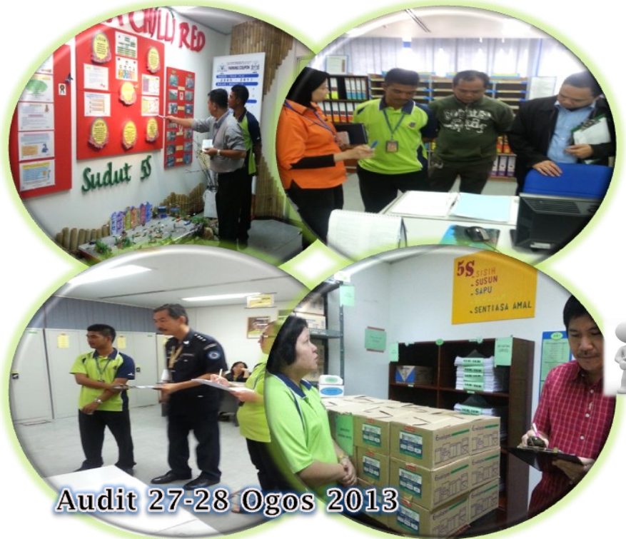
Audit 27-28 Ogos 2013

Sepanjang tahun 2013 hingga Ogos 2014 beberapa siri audit Dalaman telah dilakukan. Untuk persijilan kali ini JK Audit lebih memfokuskan audit di Bengkel memandangkan ia merupakan Zon Baru dan pastinya perlukan lebih banyak pementauan dibuat. Walau bagaimanapun JK Audit tetap membuat Audit seperti biasa di Bangunan MBKS untuk memastikan semua Zon akan lebih bersedia untuk Persijilan semula 5S. Selain itu Pra audit juga dibuat ke atas Bengkel untuk mendapatkan maklumbalas dari MPC yang mana apa jua komen yang diberi akan dijadikan rujukan untuk menambahbaik amalan 5S di Bengkel